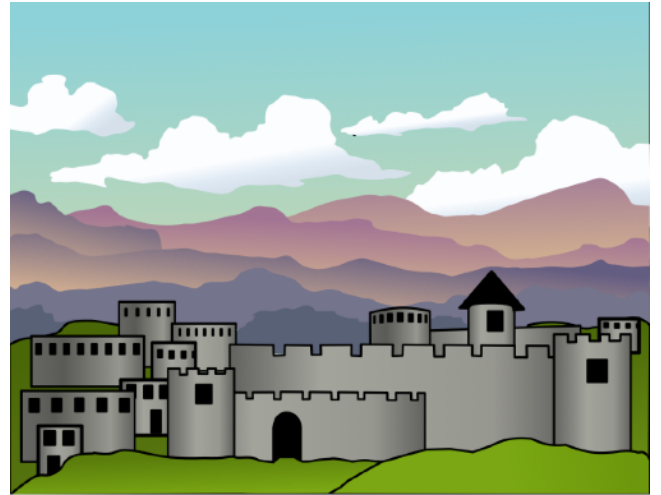
Ang JERUSALEM ay isang lungsod sa MOUNT ZION.

Ang bahay ng Panginoon ay itatatag sa mga huling araw. Ang salita ng Diyos, ang batas ay magmumula sa Jerusalem at Zion.